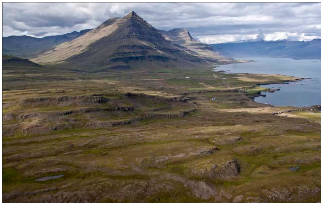
Hálsar í Djúpavogshreppi, horft til Búlandstinds og inn Berufjörð.

ekki ganga í framtíðinni en hreindýrum verður seint haldið frá. Það verður þó tjarnaklukkunum að skaðlausu.