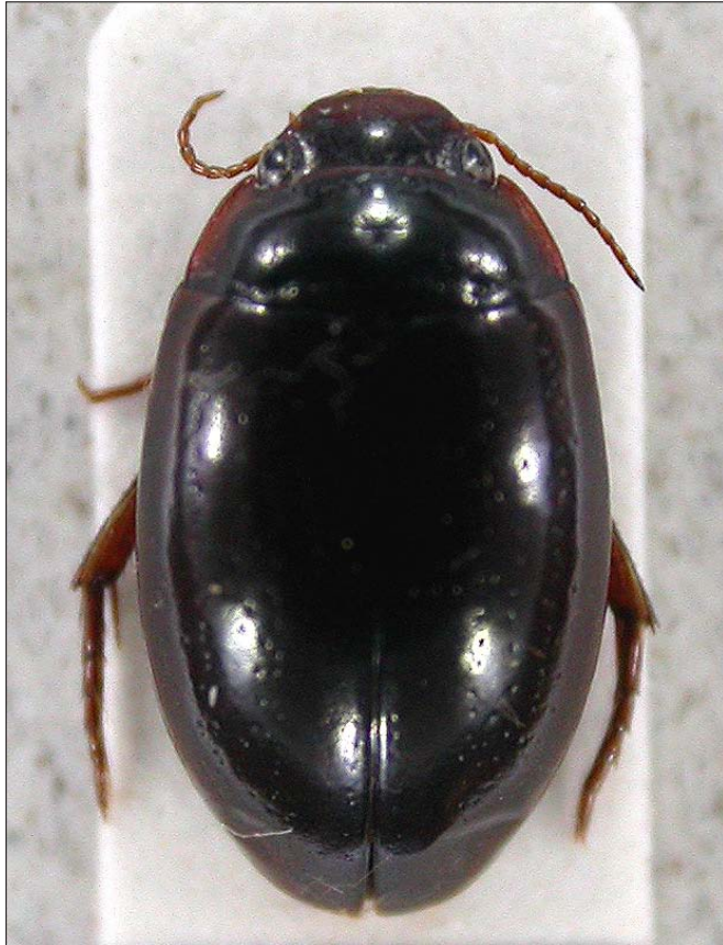
Tjarnaklukka, safneintak frá Hálsun.